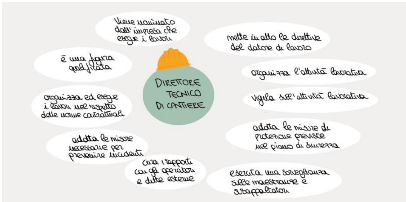
Direttore tecnico di cantiere